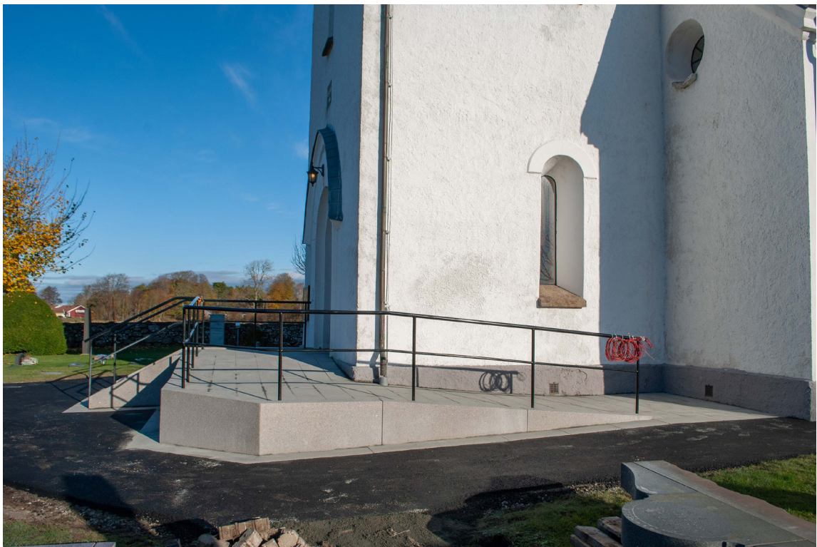
Rampen är byggd runt det sydöstra hörnet av tornet.