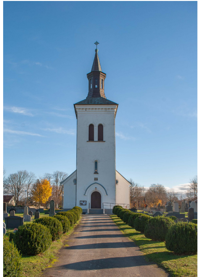
Rampen och den ny trappan har inte påverkat helhetsintrycket av kyrkan.

Ny asfalt har lagts runt rampen. Den asfalterade ytan har ökats något för att skapa en tillräckligt bred passage förbi rampens sydvästra hörn samt för att skapa en tillräcklig svängyta upp på rampen.