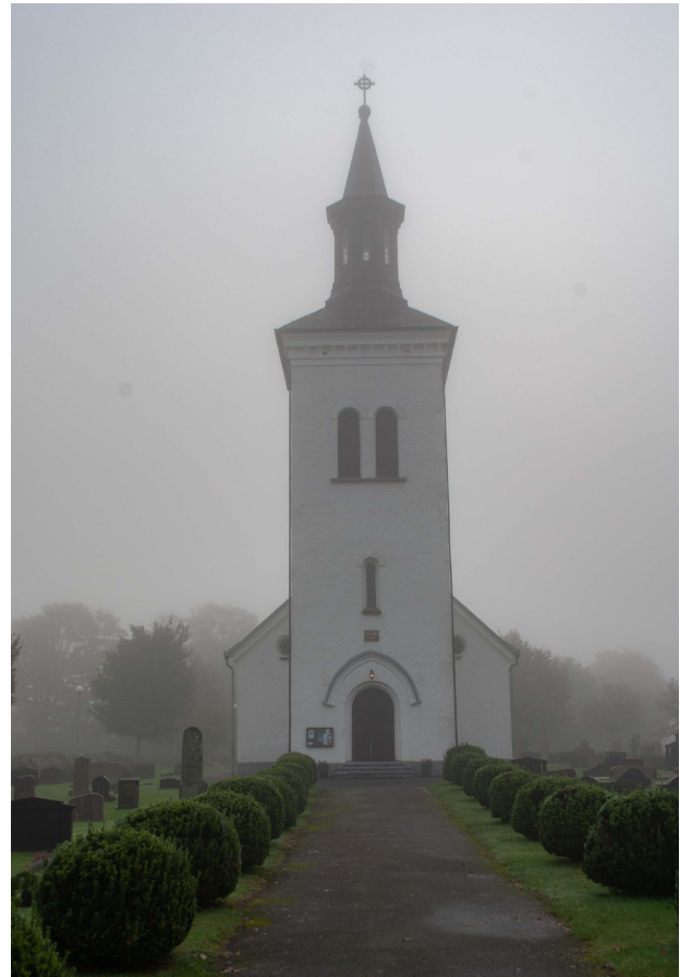
Hunnestads kyrka och trappan till entréporten i väster, innan utförda åtgärder.