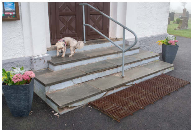
Trappan var sentida med flera skador.

Mitt på trappan finns ett enkelt utformat räcke, i galvat utförande. Framför trappan ligger ett skrapgaller i metall.